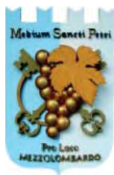
Pro loco di Mezzolombardo

Nel momento in cui un'associazione rinnova il direttivo, questo si pone degli obiettivi, uno dei quali è la collaborazione tra le associazioni della borgata.